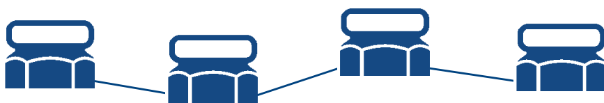
Boj LW 230V/40W Max 8 pcs on each outlet